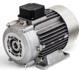
MOTOR MAZZONI MEC-SERIE