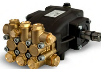
POMP MAZZONI POMP

De MAZZONI MEC-serie biedt een onderhoudsvrije elektrische inductiemotor met thermische bescherming, wat zorgt voor betrouwbaarheid, duurzaamheid, veiligheid en energie-efficiëntie. De elastische koppeling, die trillingen in het systeem zal verminderen, draagt bij aan een verbeterde levensduur van de apparatuur en vermindert het de kans op schade aan de motor of andere componenten. Het zorgt ook voor een soepele werking en vermindert geluidsniveaus, waardoor het comfort van de gebruikers wordt verbeterd.