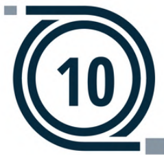
10 METER HOGE DRUK SLANG