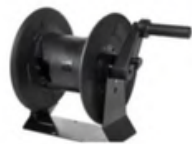
SLANGHASPEL OP DE MACHINE