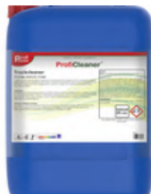
TRUCKCLEANER EXTRA INDUSTRIAL 25 LTR