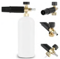
POT TBV INSCHUIMEN