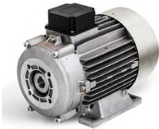
MOTOR MAZZONI MEC-SERIE