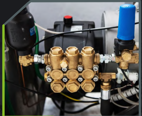
DETAIL BYPASS-KLEP EN DRUKMETER

De "In line professional pump" is niet alleen krachtig en duurzaam, maar ook uiterst betrouwbaar. Dankzij de verbindingstangen, messing kop en drie keramische zuigers kan deze pomp hoge druk leveren en zorgt voor een constante en efficiënte doorstroming. De pomp is speciaal ontworpen om te voldoen aan de eisen van veeleisende professionele toepassingen, zoals hogedrukreiniging en industrieel spuiten, waar prestaties en duurzaamheid van cruciaal belang zijn.