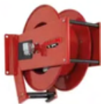
SLANGHASPEL ZWENKBAAR 20 MTR