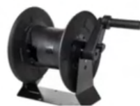
SLANGHASPEL 20 METER